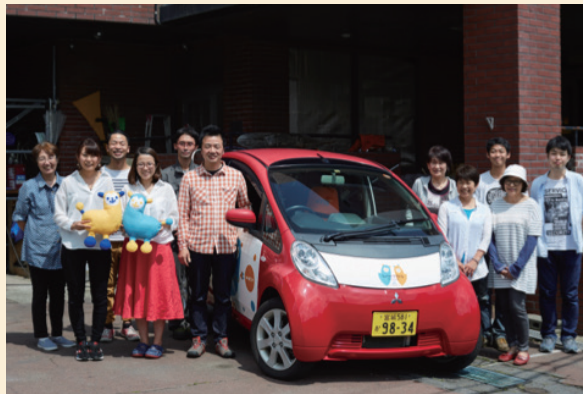
寄付車を活用した社会貢献のモデルを石巻に作ることを目指し、日々奮闘しております！