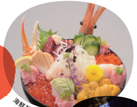
海鮮丼(牡鹿・雄勝)